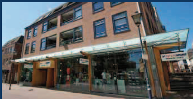
Arnhem, Jansplein 20-22