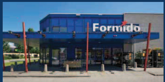
Zwolle, Charles Storkstraat 3