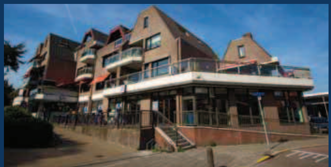
Hillegom, Houttuin 1 – 12