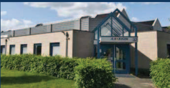
Zwolle, Stephensonstraat 32

*sectorale verdeling SynVest RealEstate Fund N.V. per 1-4-2011