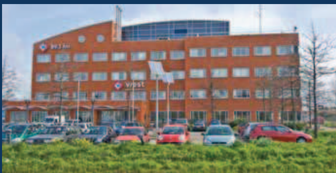
Den Haag, Laan van 's Gravenmade 2

Het is wel van belang dat uw erfgenamen binnen een jaar na overlijden beslissen op welke wijze het kapitaal wordt aangewend. Hierbij gelden de volgende voorwaarden: