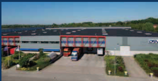
's-Heerenberg, De Immenhorst 7

*De uitkeringen starten uiterlijk in het jaar waarin men 70 wordt