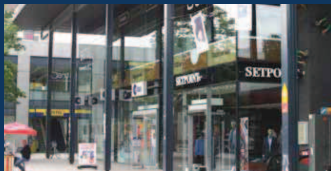
Emmen, winkelcentrum de Weijert

‘EEN GOEDE BELEGGING VOOR UW GOUDEN HANDDRUK’